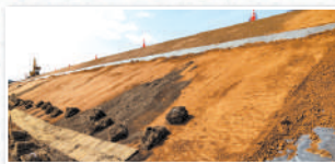
Bタイプに覆土し張芝を施工した例

他工法と組み合わせが可能。自然石護岸工との併用や植生待ち受け型としても施工できます。