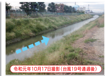
令和元年10月17日撮影(台風19号通過後)