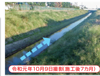
令和元年10月9日撮影(施工後7ヵ月)