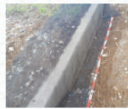
グリットネット敷き込み状況

上流および下流端部には、階段工や端止めコンクリートを設けグリットネットを敷き込みます。グリットシーバーV3敷設後、グリットシーバーV3を覆うようにグリットネットを折り返します。