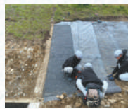
グリットネット折り返し状況