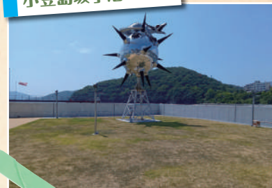
小豆島坂手港 香川県