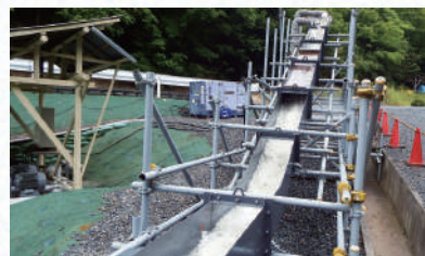
自社研究圃場における流速試験

キョーリョッカー-21は、大型形状に加えて、専用ピンの併用により、施工直後から流速2.5m/sに対応できます。 汽水域の護岸や遊水地など、塩害や流水のおそれのある場所へも施工できます。