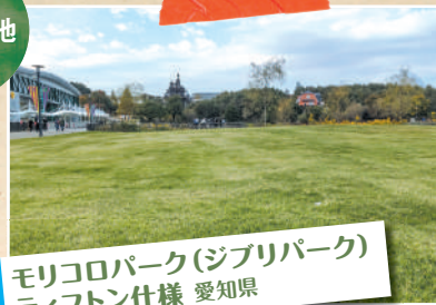
モリコロパーク(ジブリパーク) ティフトン仕様 愛知県