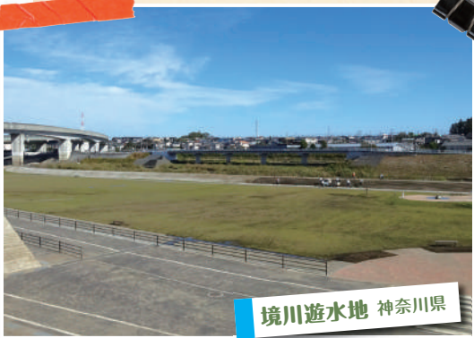
境川遊水地 神奈川県

遮水シート+接続ブロック+覆土30cm+張芝 工期短縮とNETIS登録工法のため採用 されました。