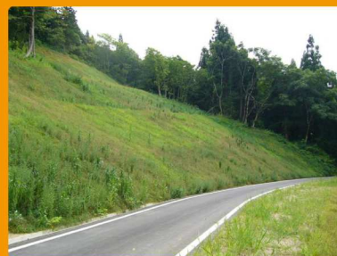
道路災害復旧工事