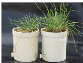
対照区 植物生育促進剤添加区