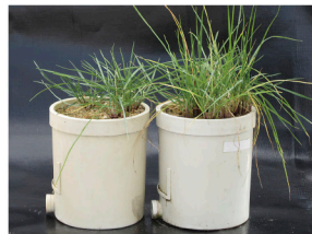
対照区 植物生育促進剤添加区