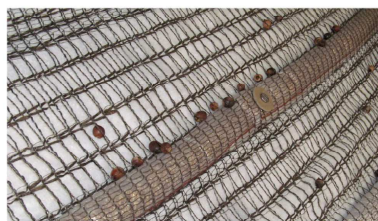
飛来ステーション 28粒／100粒

試験条件 ●勾配：1：1.0 ●落下高：約3m ●使用種子：アラカシ100粒／試験区