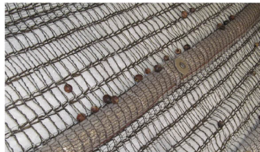
飛来ステーション 31粒 / 100粒

試験条件 ●勾配:1:1.0 ●落下高:3m ●使用種子:アラカシ100粒 / 試験区