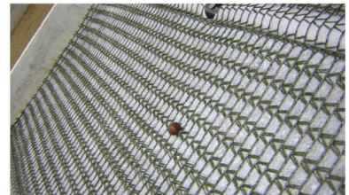
植生マット 3粒 / 100粒