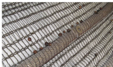
飛来ステーション 31粒／100粒

試験条件 ●勾配：1：1.0 ●落下高：3m ●使用種子：アラカシ100粒／試験区