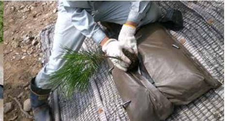
植付け (中央開口部の保護紙を破り、苗を植付ける)